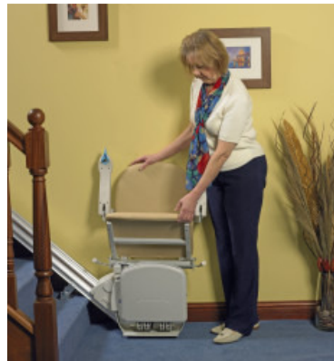
Platz sparend einklappen