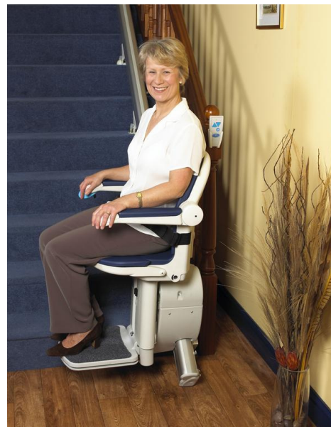
besonders ruhige Fahrt

Der M1000 ist sehr einfach in seiner Anwendung. Er ist durch einen Schlüsselschalter geschützt. Nach Betätigung dieses Schalters wird der Betätigungshebel einfach in Fahrtrichtung gehalten. Sobald Sie am Ende der Treppe ankommen, dreht sich der Sitz dem Treppenabsatz zu. Dies ermöglicht ein einfaches und sicheres Ein- und Aussteigen. Auf Wunsch kann der Treppenlift auch mit einem elektrischen Dreh-Sitz ausgestattet werden. Dadurch wird das Drehen des Sitzes am Ausstieg noch einfacher und sicherer. Für den M1000 sind vier Sitzvarianten (siehe Spezialsitze) sowie eine große Auswahl an Farben erhältlich. Der Bedienhebel kann an beiden Armstützen angebracht werden.