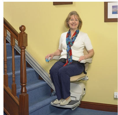
Ruhige und komfortable Fahrt

Der Treppenlift ist batteriebetrieben und funktioniert auch bei Stromausfall. Die Batterie wird von der Netzstromversorgung automatisch nachgeladen. Der M950 empfängt diese Ladung unabhängig davon, an welcher Stelle der Schiene sich der Treppenlift gerade befindet. Dies bedeutet, dass der Treppenlift, wenn er nicht gebraucht wird, an jedem Abschnitt der Schiene geparkt werden kann.