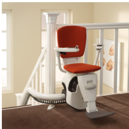
Der F 2 am oberen Start

Durch die praktische Klappfunktion kann der F2 überall platzsparend geparkt werden.