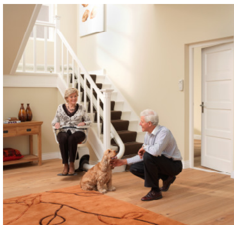
INNENLÄUFER MIT 180°-START