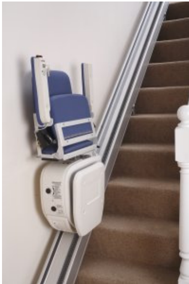
Geklappt nur 28 cm

Für den Einbau sind keine Umbaumaßnahmen erforderlich wodurch der C 100 nahezu überall eingebaut werden kann.